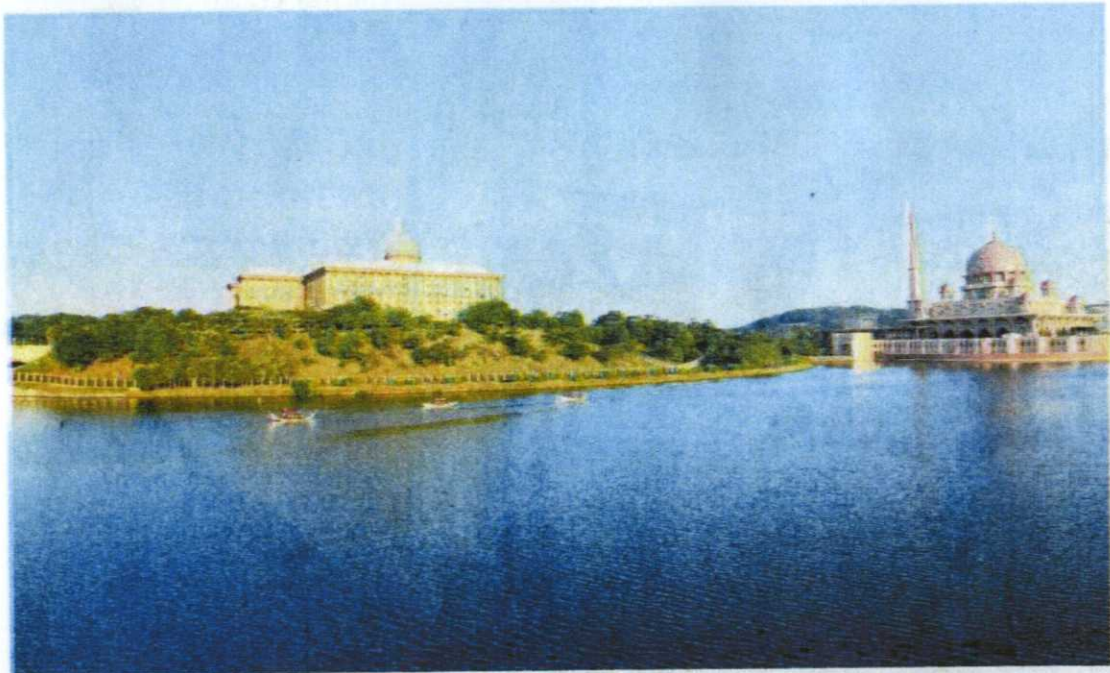
TASIK Putrajaya mungkin dipilih jadi sumber air penduduk Lembah Klang jika paras air empangan di tahap kritikal. - GAMBAR HIASAN

"Fenomeno El Nino mendatangkan cuaca panas berpanjangan bakal memberi impak cukup besar pada negara dengan melibatkan lima sektor iaitu domestik, pertanian, industri, janakuasa elektrik dan kesihatan," katanya.