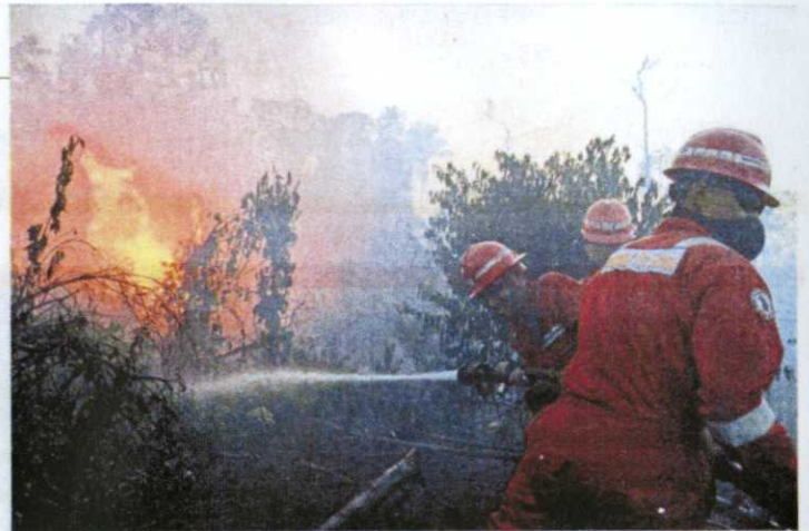
Firemen spraying water to extinguish wildfires in Dumai, Riau province in Indonesia recently.

from the readings four hours earlier, when unhealthy API levels were recorded in Port Klang (102), Shah Alam (103), Cheras (102) and Putrajaya (107).